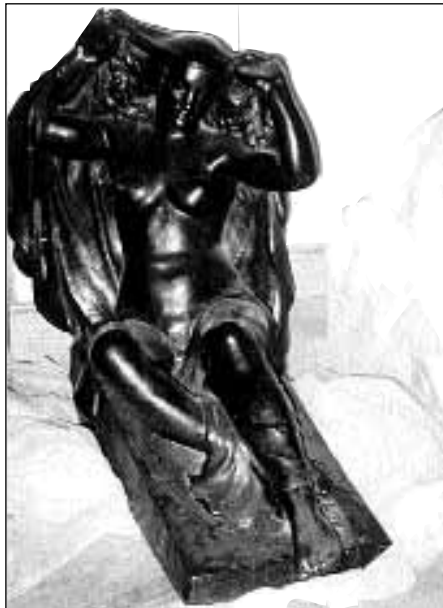
Moirer Ödön: Feltámadás (1920 körül)