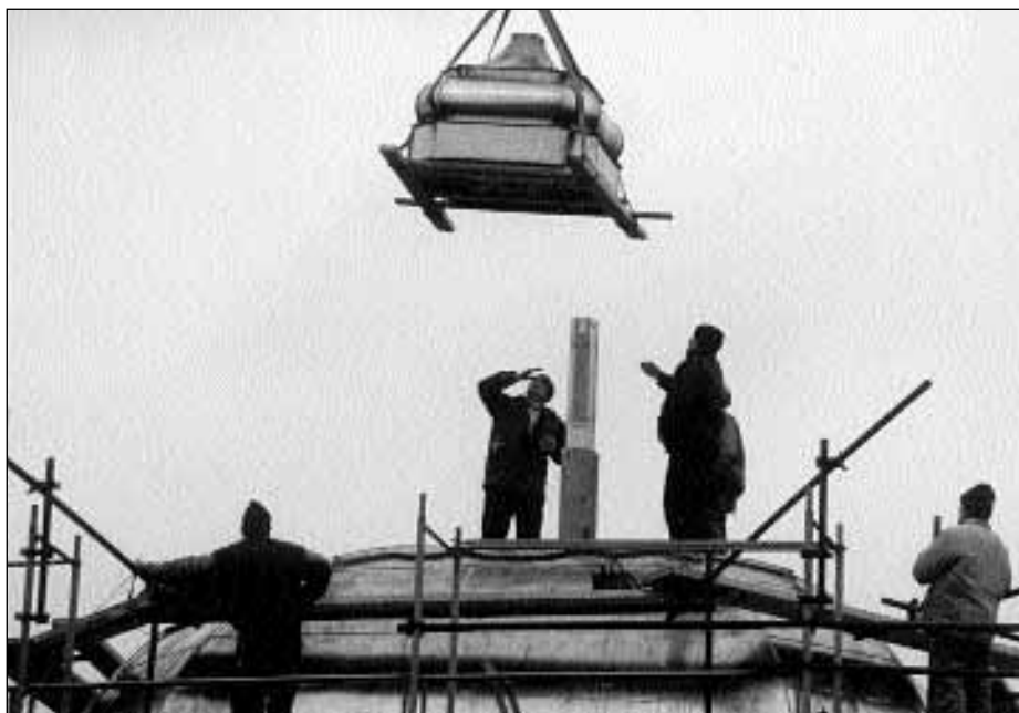
Daruval emelik a helyére a kastélybeli Orangerie új rézkupolájának zárósapkáját