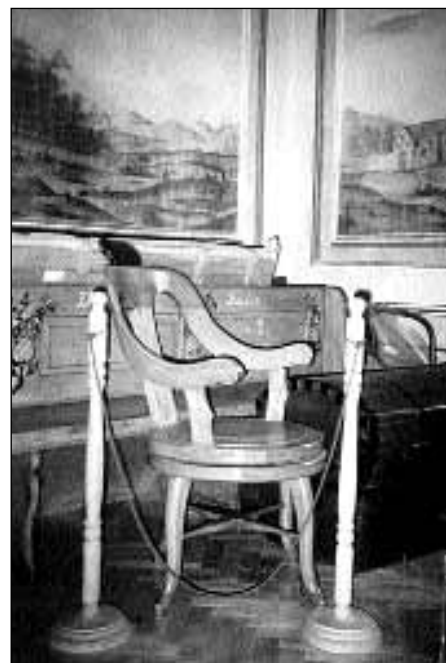
A tárgyak a barokk falfestésű teremben vaárják végső elhelyezésüket