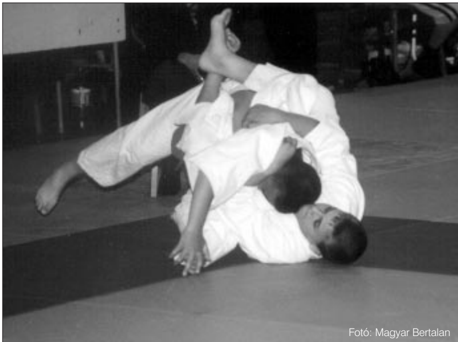
Fotó: Magyar Bertalan