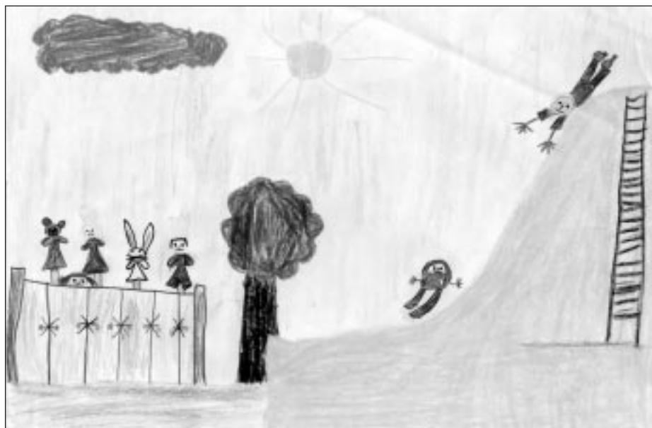
Egy nagy csoportos óvodás vágya és elképzelése

Akik még szeretnék elmondani, hogy milyen programokra gondoltak 27-én, a gyereknapon, az elárulhatja vágyát személyesen vagy telefonon a két szervező-