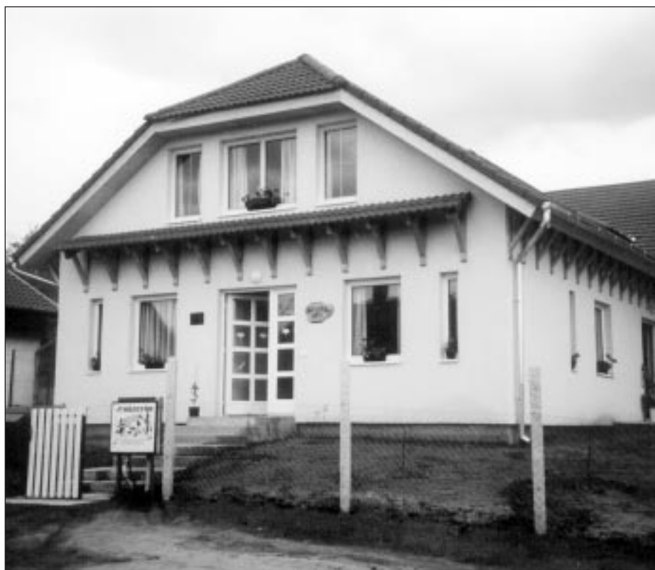
Az igényesen kialakított új műhely épülete