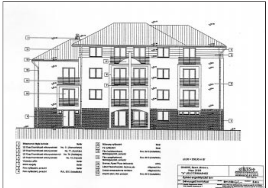
A Szent János és a Lumniczer utca által határolt területre területre tervezett épület rajza

Sikeres pályázat esetén két háromemeletes és egy kétemeletes épületet