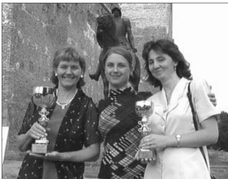
A gödöllői küldöttség és a díjak