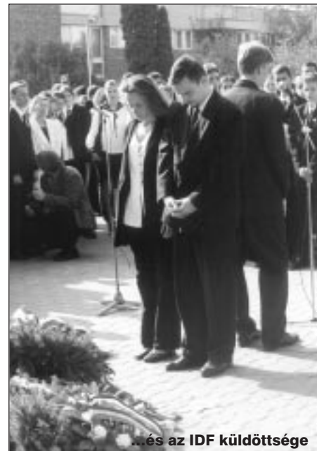
...és az IDF küldöttsége